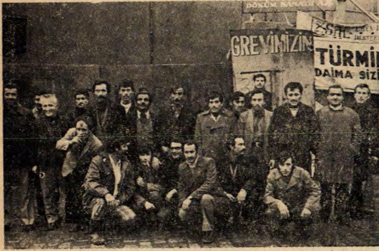
İzsal işçilerinin grevi devam ediyor.

İŞÇİ DAVASI muhabirinin İZSAL işçileri ile yaptığı konuşmaları aşağıda veriyoruz :