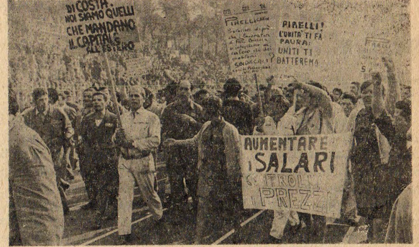
İtalyan işçileri genel grev yürüyüşünde..