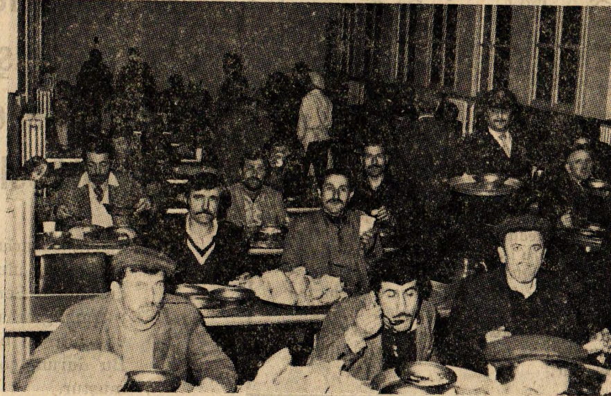
Maden işçileri pavyon yemekhanesinde topluca yemek yerken görülüyor.

Ereğli Kömürleri İşletmesi (EKİ) maden ocaklarında çalışan işçilerin bir kısmı pavyonlarda (işçi yurtlarında) yatıp kalkıyor. Bu işçiler 10,50 lira iâşe bedeli karşılığı olarak yemeklerini de pavyonlarda yiyor. Evli, 6 çocuklu bir domuzdamcı ustası maden işçisi kendisiyle yaptığımız konuşmada yemek masasından aç kalktığını söyledi. Maden işçisi ile arkadaşımızın konuşması şu şekilde oldu :